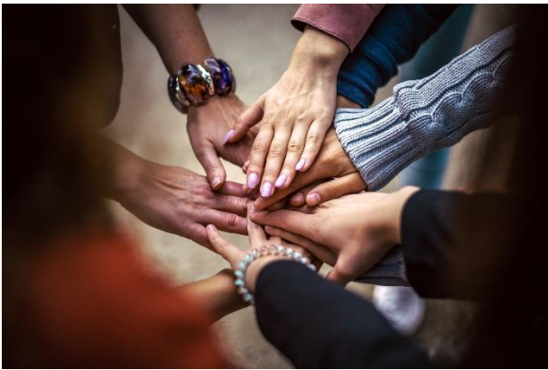
RE/init e. V. unterstützt Menschen in der Region Emscher-Lippe.