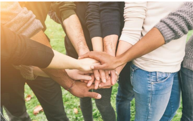
RE/init e. V. unterstützt Menschen in der Region Emscher-Lippe.