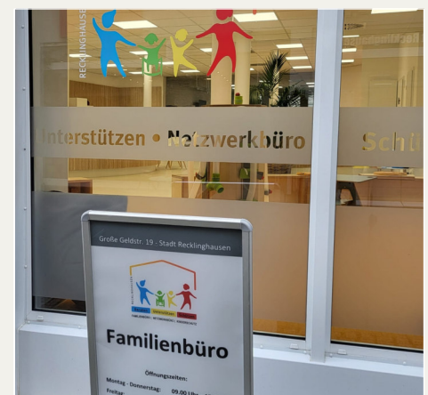
Im Familienbüro ist jede*r willkommen. Hier gibt es direkte Hilfe. Oder es werden Ansprechpartner genannt, die sich gut auskennen.