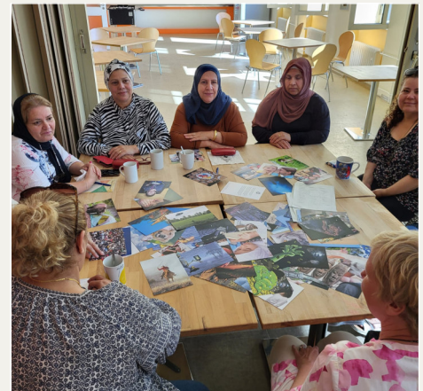
Bildkarten regen zum Geschichtenerzählen und Deutschsprechen an. Regelmäßig stellen sich Einrichtungen vor oder wir unternehmen Ausflüge.

In den vergangenen Monaten haben sich z.B. die Schuldnerberatung und die Frauenberatungsstelle vorgestellt. Informativ waren die Besuche der Berufs- und Qualifikationsmessen. Ausflüge führten in den Tierpark und den Zoo nach Gelsenkirchen. Außerdem gab es eine Stadtführung in Recklinghausen. Regelmäßig erzählen auch Frauen mit Migrationserfahrung von ihrem Weg in die Arbeitswelt. Diese Berichte machen Mut. In den kommenden Wochen stehen das Thema Frauengesundheit und ein Besuch im Jüdischen Museum auf dem Programm. Wir freuen uns schon!