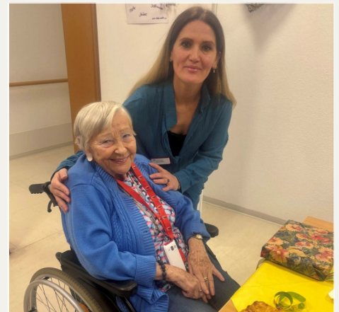
Mit den Bewohnerinnen und Bewohnern versteht Asitila sich sehr gut. Das hilft ihr bei der Arbeit.