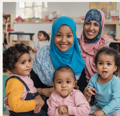
Die Eltern-Kind-Gruppe trifft sich immer dienstags von 10.00 – 12.00 Uhr im Jugendtreff Recklinghausen Süd. . Foto: Canva

Anmeldung: Familienbildungsstätte Recklinghausen, 02361 406402-0.